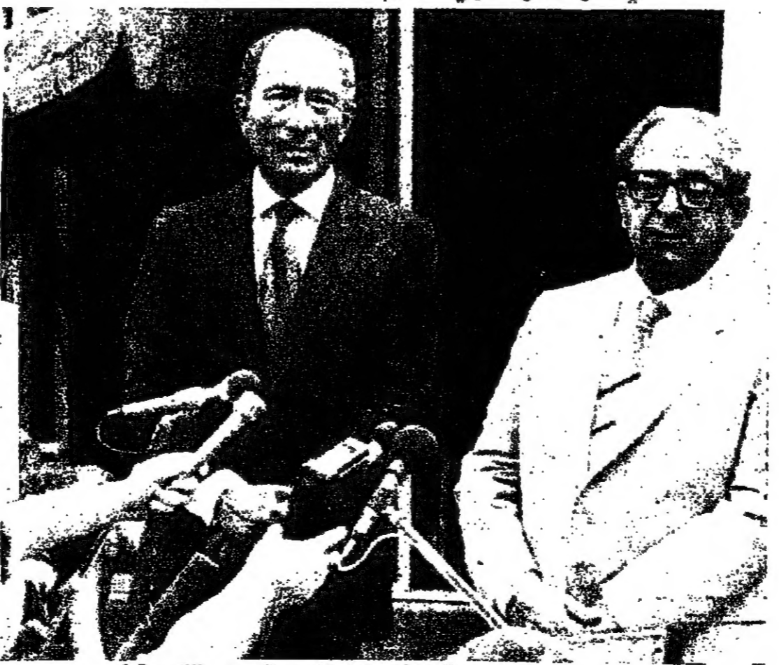
الرئيسان ناسون والسادات اثناء المؤتمر الصحفي الذي عقده في ختام جولة المحادثات الثانية في ميت ابو الكوم .